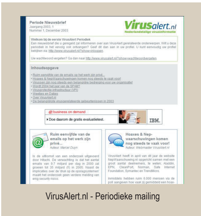
VirusAlert.nl - Periodieke mailing